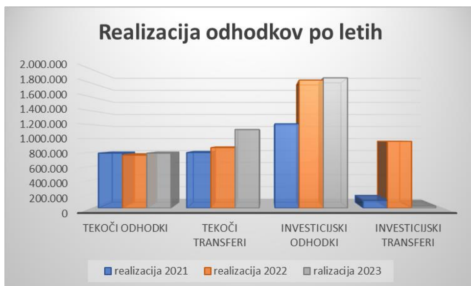
Graf 4: Realizacija odhodkov po letih in po skupinah

Delež odhodkov po skupinah je glede na skupne odhodke leta 2023 razviden iz prikaza, na spodnjem grafu: